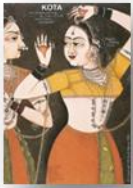
KOTA – Die Gemäldesammlung des Fürsten von Kota Villa Wesendonck, 23.11.1997–8.2.1998