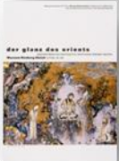
Der Glanz des Orients. Islamische Malerei der Sammlung Prinz und Prinzessin Sadruddin Aga Khan Villa Wesendonck, 17.5.1998–30.8.1998